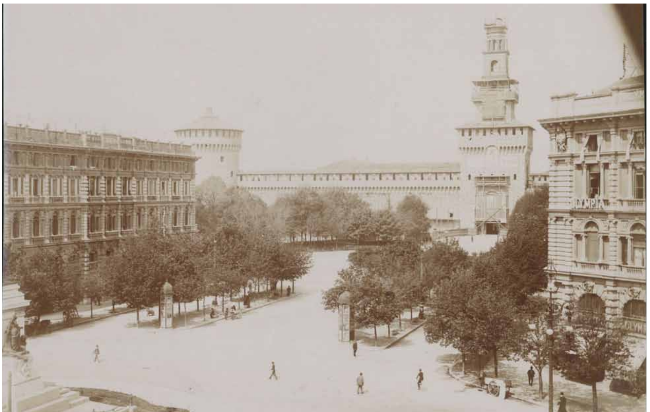
Largo Cairoli. Visibili la Torre Umberto I, detta del Filarete (durante le ultime fasi della costruzione) e il Torrione sud (di Santo Spirito), 1905 Largo Cairoli. Also visible the Torre Umberto I called del Filarete (during the last phases of construction) and the Torrione sud (Santo Spirito), 1905