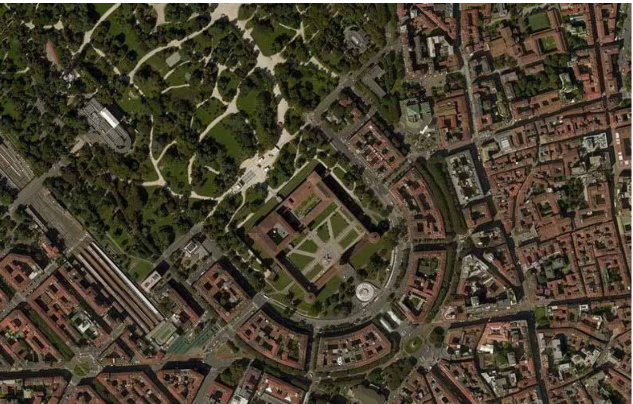
Fotopiano esteso al contesto Photo extended to the context