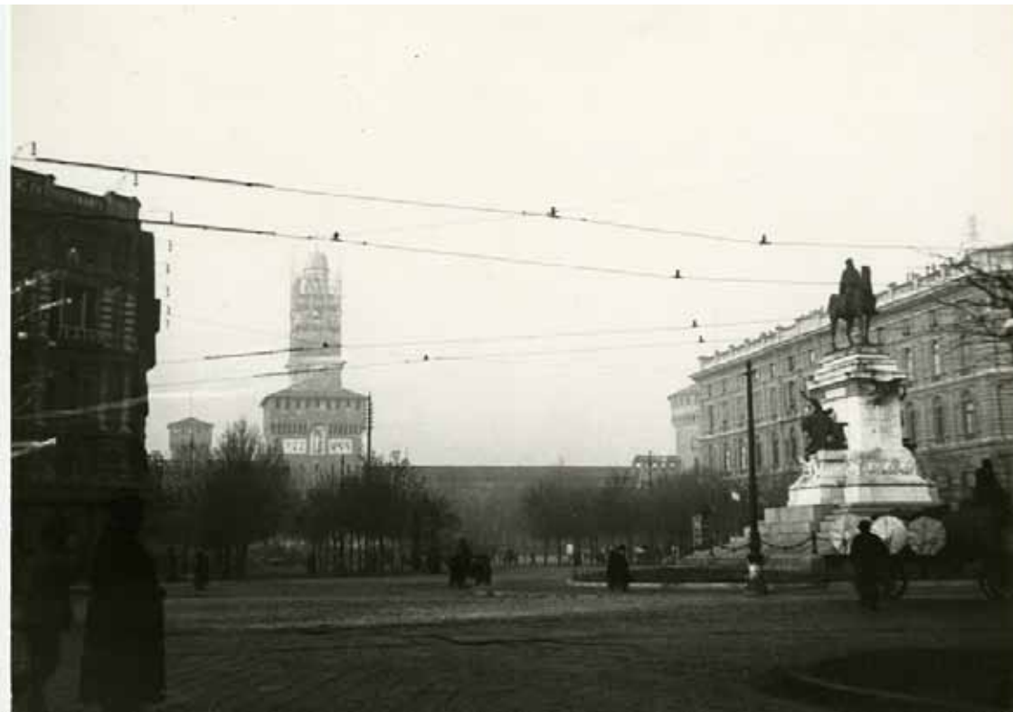
Largo Cairoli con il monumento a Giuseppe Garibaldi. Visibile sullo sfondo il Castello Sforzesco con la Torre del Filarete in costruzione, 1905 circa

North east side of Castello Sforzesco with the Torre Falconiera, the Ponticella di Lodovico il Moro, the Rivellino dei Carmini (or "di Porta Comasina") and the Torre di Bona di Savoia, 1905