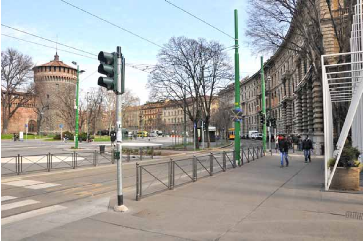
Piazza Castello / via Beltrami Piazza Castello / via Beltrami