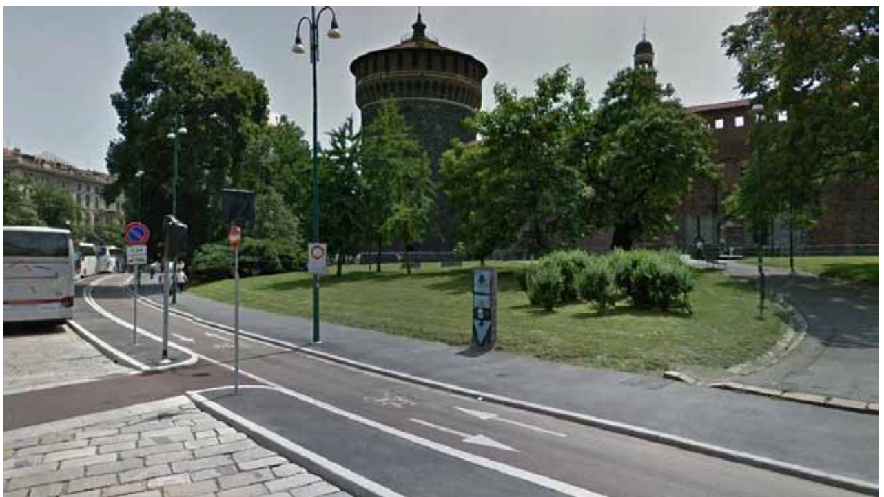
Piazza Castello / Ciclabile Piazza Castello / Bike Path