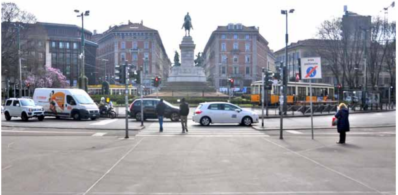
Via Beltrami / piazza Cairoli, monumento di Giuseppe Garibaldi Via Beltrami / piazza Cairoli, monument to Giuseppe Garibaldi