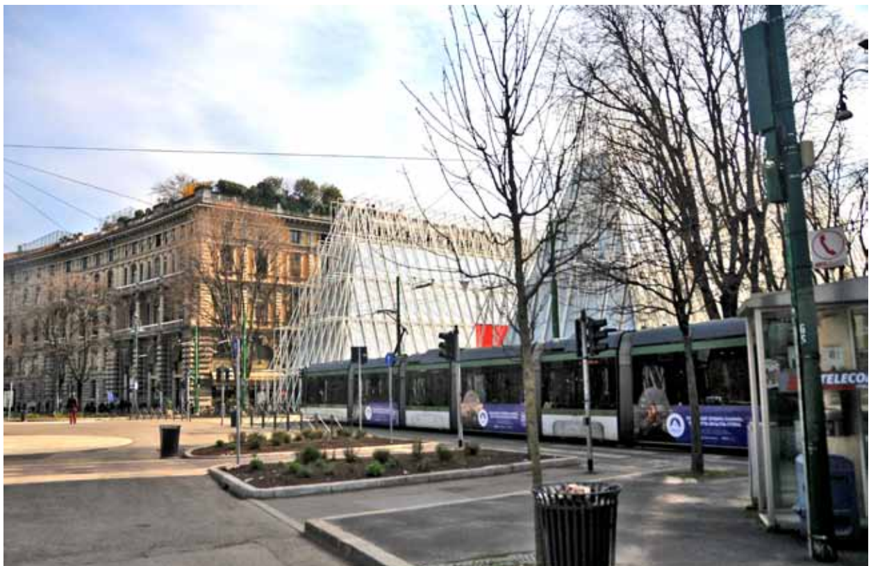
Piazza Castello, linea tramviaria ed Expo Gate all'inizio di via Beltrami Piazza Castello, tram line and Expo Gate at the beginning of via Beltrami