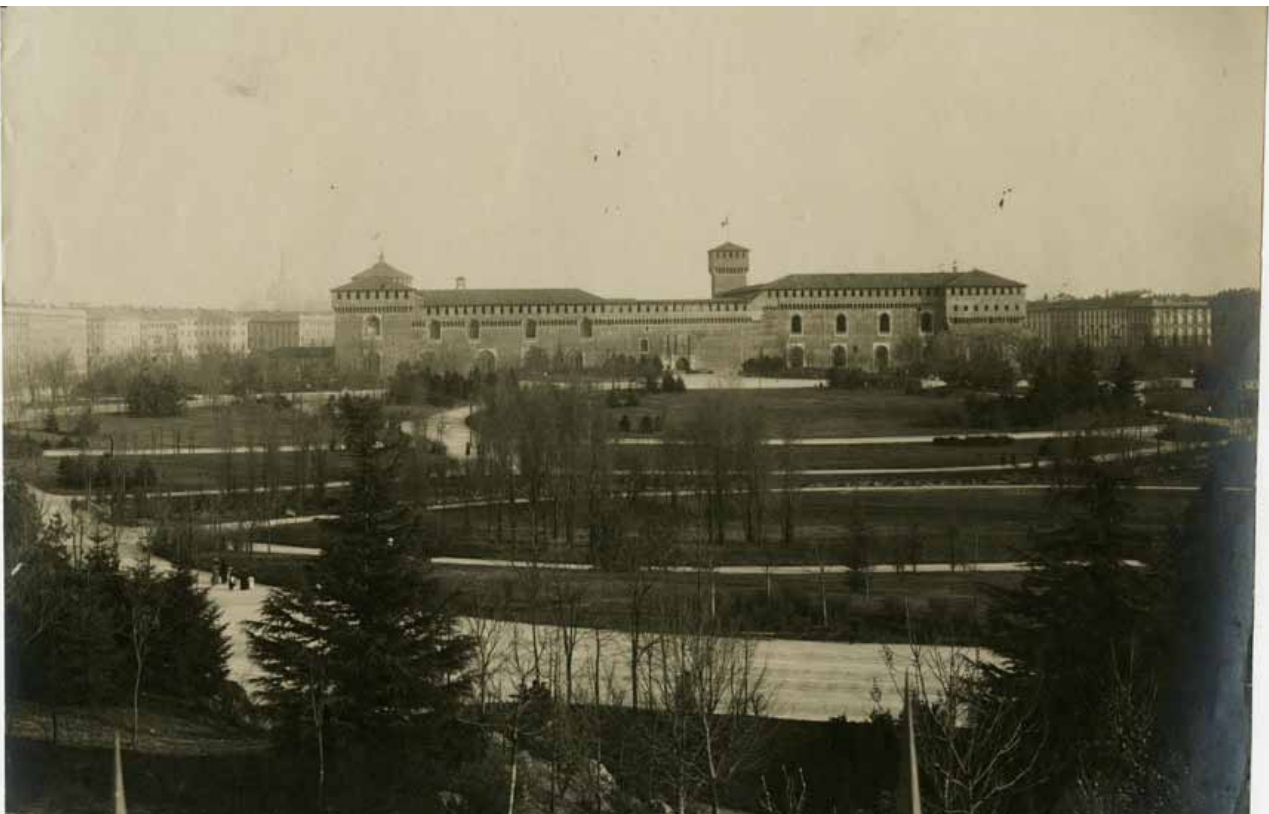
Castello Sforzesco visto dal Parco sempione. Visibili sullo sfondo Foro Buonaparte e il Duomo, 1894 Castello Sforzesco seen from Parco Sempione. Foro Buonaparte and Duomo may be seen in the background, 1894