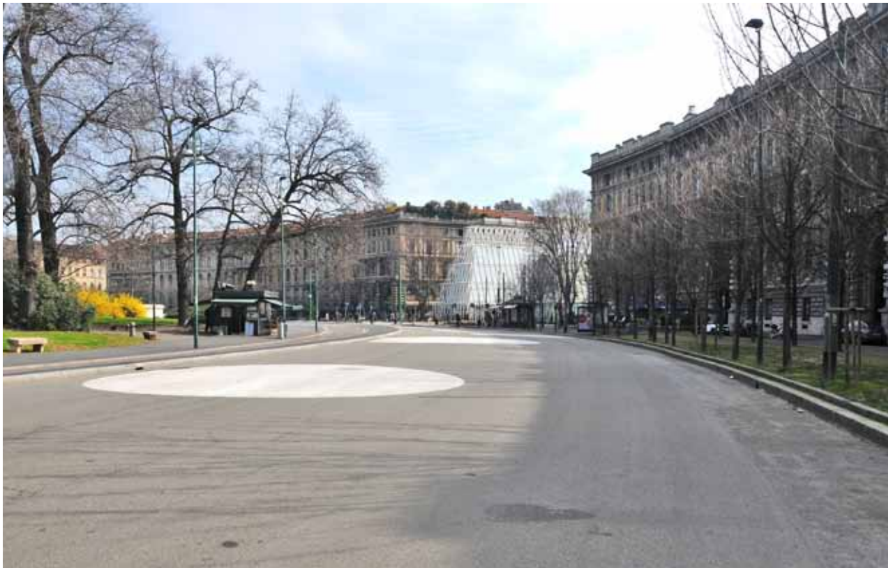
Piazza Castello, visibile Expo Gate all'inizio di via Beltrami Piazza Castello, Expo Gate visible at the beginning of via Beltrami