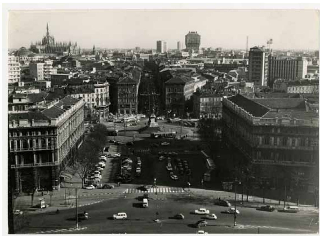
Castello Sforzesco. Veduta panoramica dalla Torre del Filarete. Visibili Duomo, Piazza Cairoli, via Dante e torre Velasca, anni ottanta Castello Sforzesco. Panoramic view from the Torre del Filarete. Visible are Duomo, Piazza Cairoli, via Dante and Torre Velasca, 1980s