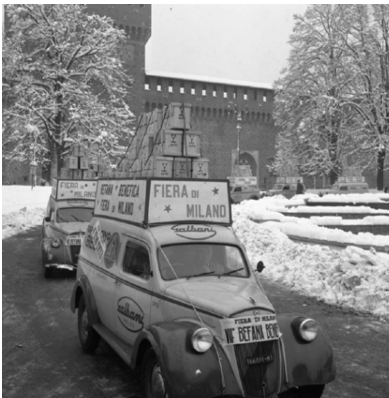
Piazza Castello, Corteo Fiera di Milano, 1954 - Archivio Storico - Fondazione Fiera Milano Piazza Castello, Parade, Fair of Milan, 1954 - Historical Archive - Fondazione Fiera Milano