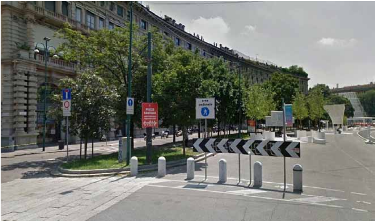
Piazza Castello / Ciclabile Piazza Castello / Bike Path