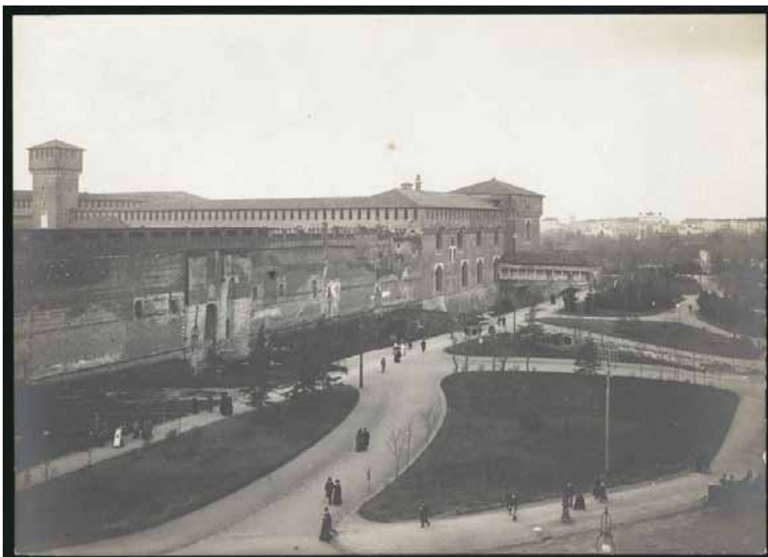
Lato nord-est del Castello Sforzesco con la Torre Falconiera, la Ponticella di Lodovico il Moro, il Rivellino dei Carmini (o "di Porta Comasina") e la Torre di Bona di Savoia, 1905

North east side of Castello Sforzesco with the Torre Falconiera, the Ponticella di Lodovico il Moro, the Rivellino dei Carmini (or "di Porta Comasina") and the Torre di Bona di Savoia, 1905