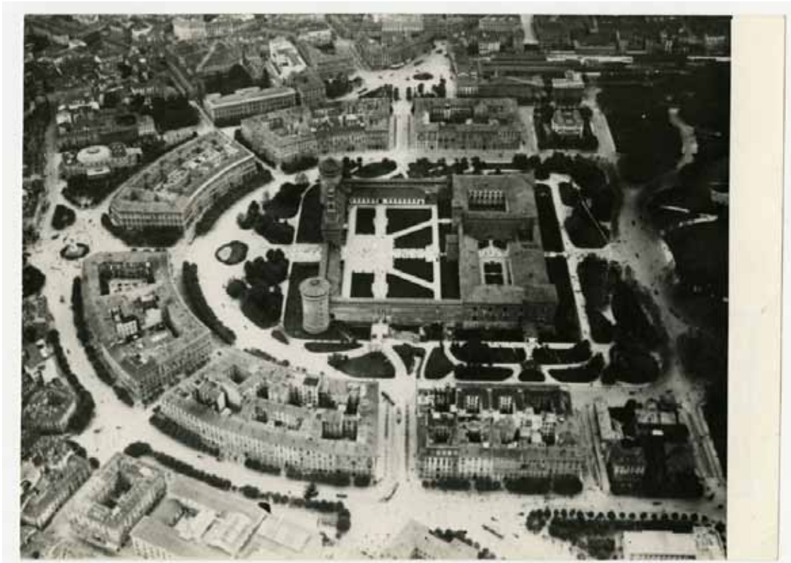
Castello Sforzesco, Foro Buonaparte, Largo Cairoli, Quintino Sella, Piazzale Cadorna, veduta dall'alto, post 1895