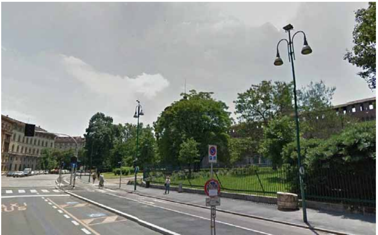
Piazza Castello / Ciclabile Piazza Castello / Bike Path