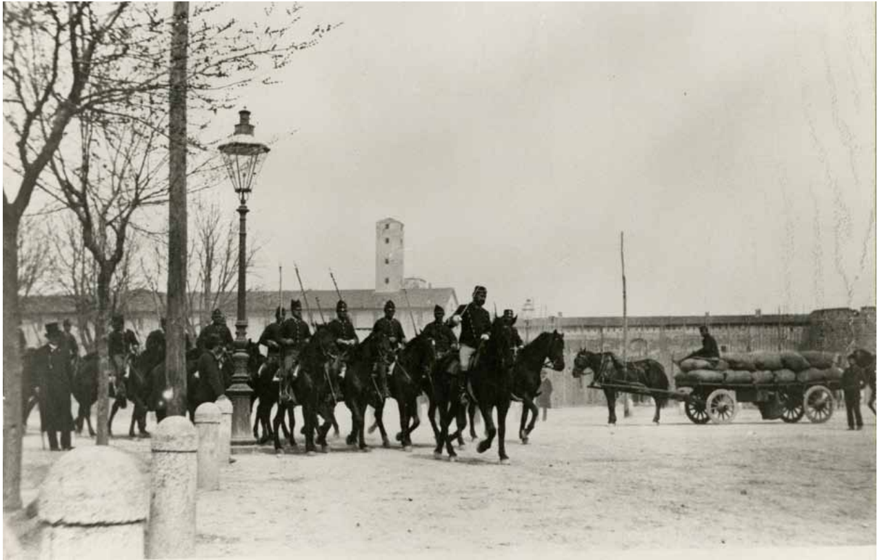
Piazza d'Armi, fine '800 Piazza d'Armi, end of 1800s