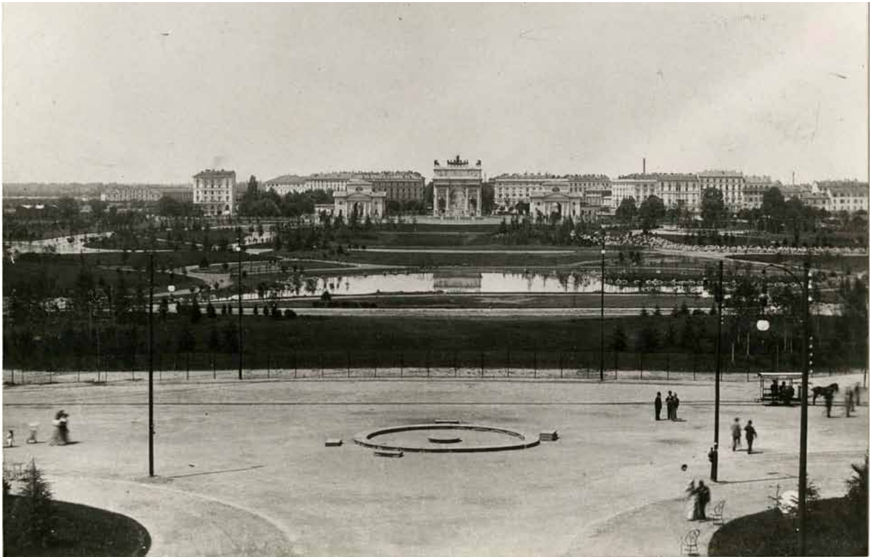
Parco Sempione con l'Arco della Pace sullo sfondo, 1894 Parco Sempione with the Arco della Pace in the background, 1894