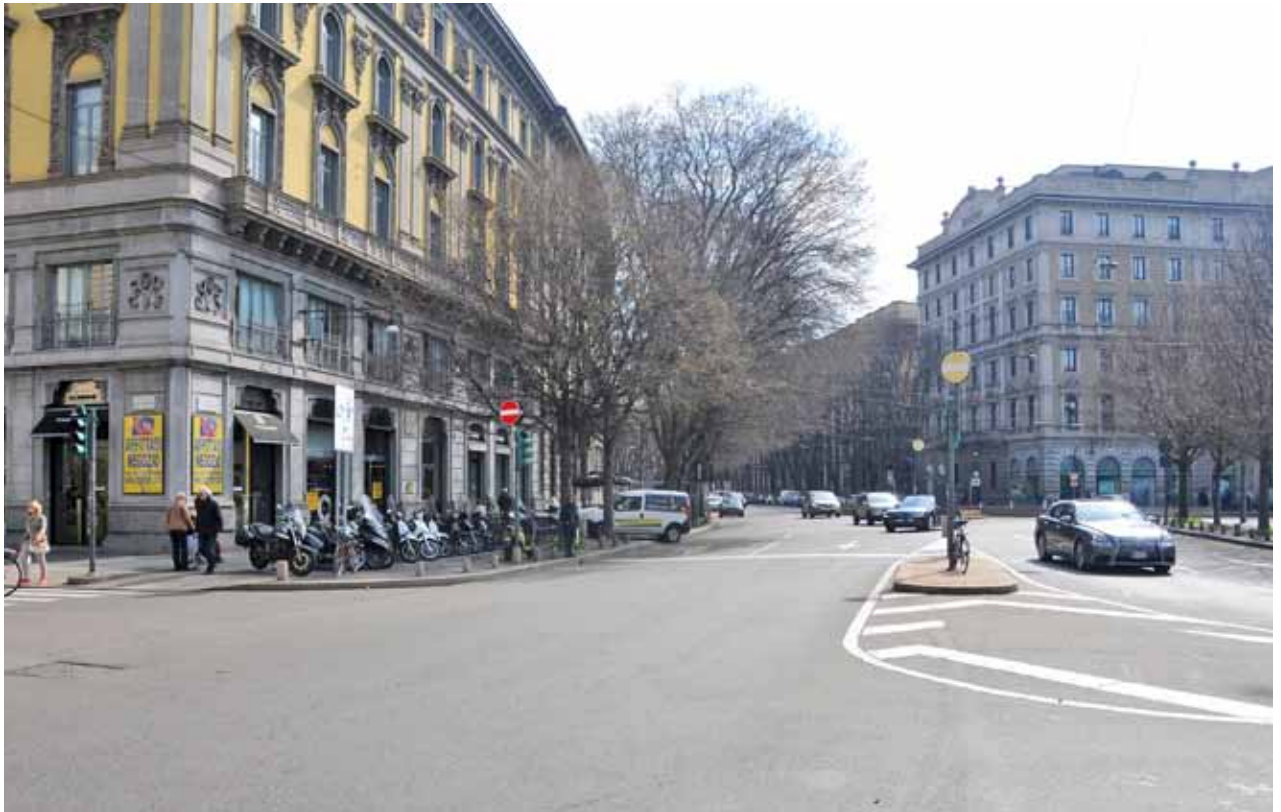
Piazza Cadorna / via Minghetti Piazza Cadorna / via Minghetti