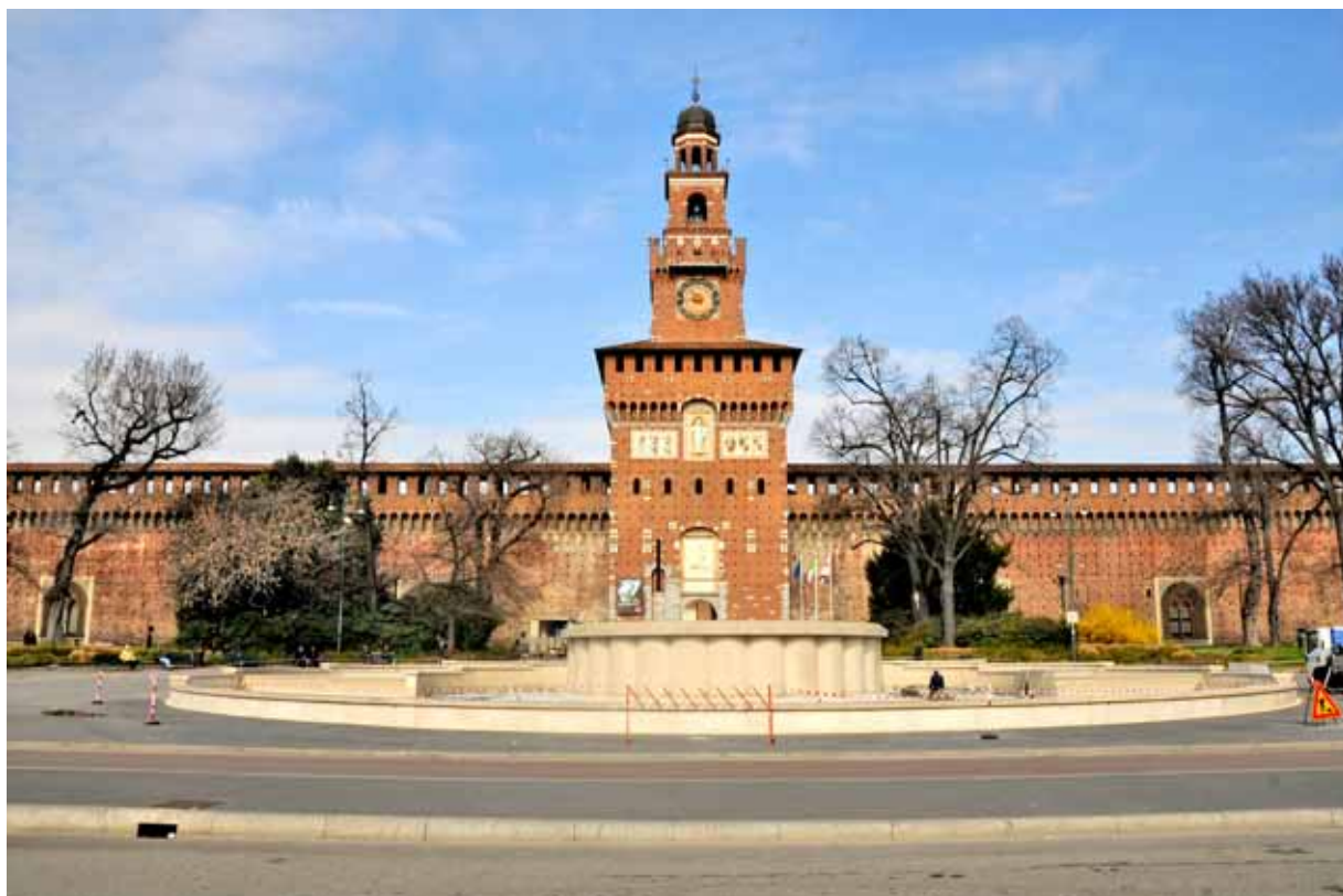
Piazza Castello, fontana davanti all'ingresso al Castello Sforzesco Piazza Castello, fountain in front of entrance to Castello Sforzesco