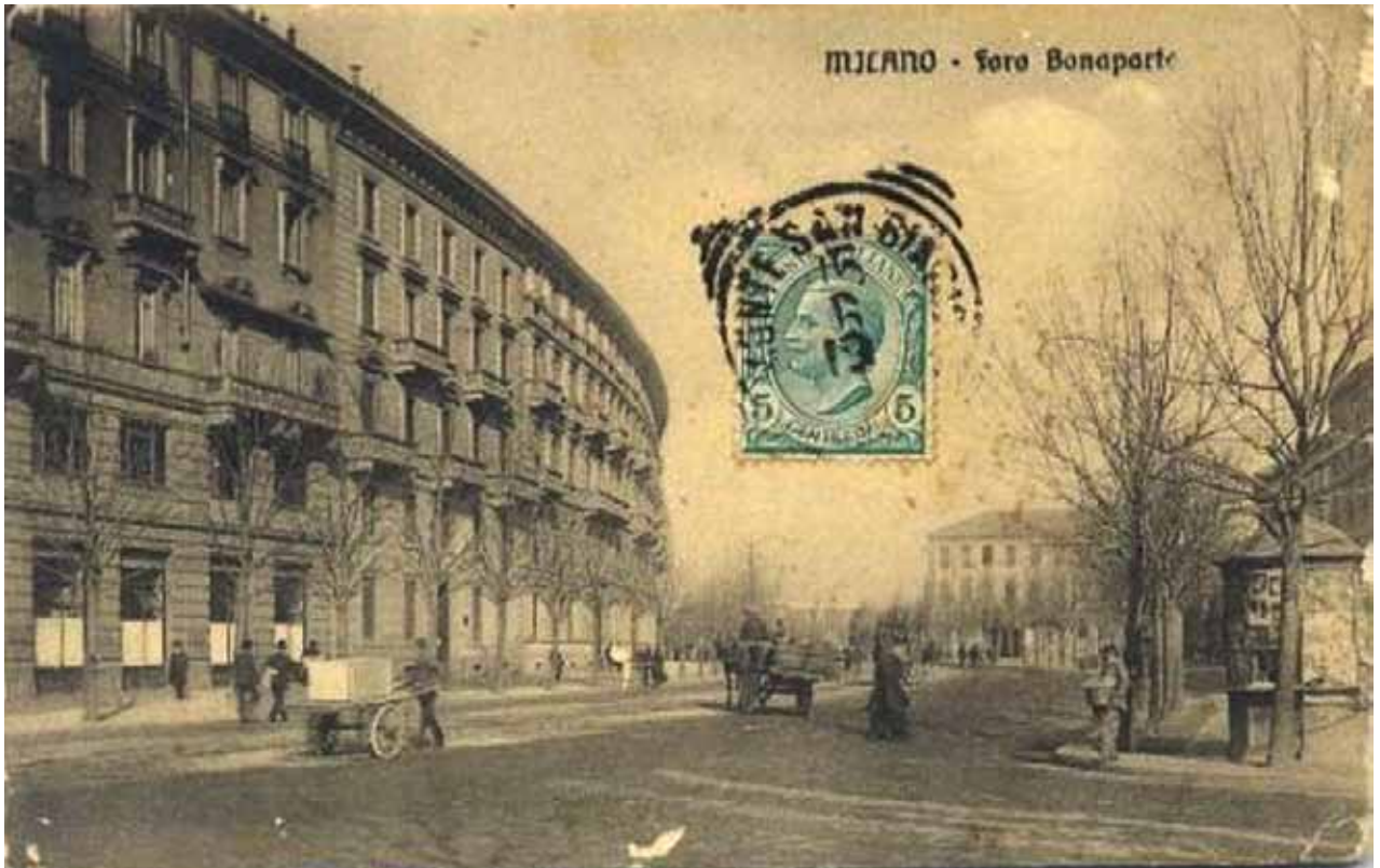
Foro Buonaparte, 1905 circa Foro Buonaparte, 1905 circa