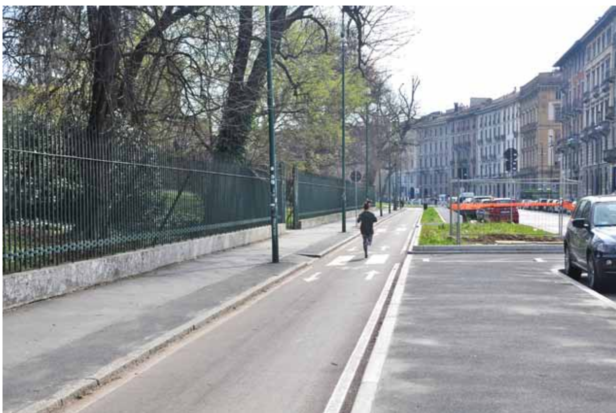
Piazza Castello, Ciclopedonale Piazza Castello, Bicycle Path