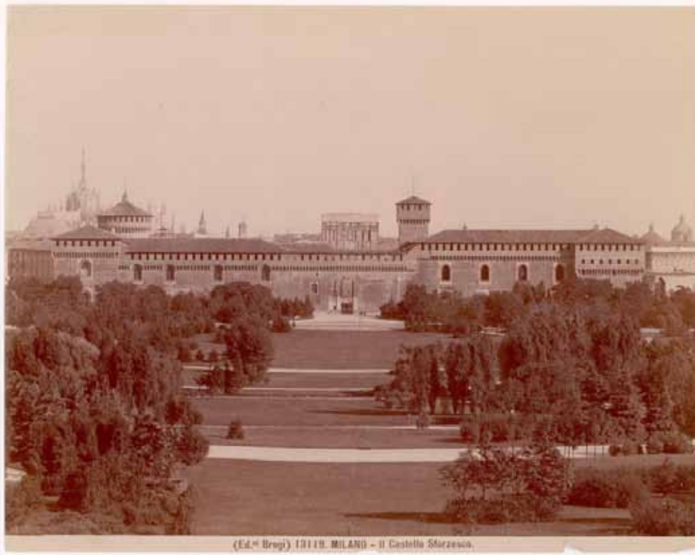
(Ed. Brogi) 1919. MILANO - Il Castello Sforzesco.