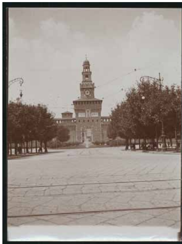
Castello Sforzesco con la Torre Umberto I, detta del Filarete. Veduta da Largo Cairoli, post 1905 Castello Sforzesco with the Torre Umberto I, called del Filarete. View from Largo Cairoli, post 1905