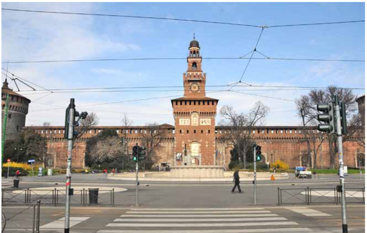
Piazza Castello ed ingresso al Castello Sforzesco Piazza Castello and entrance to Castello Sforzesco