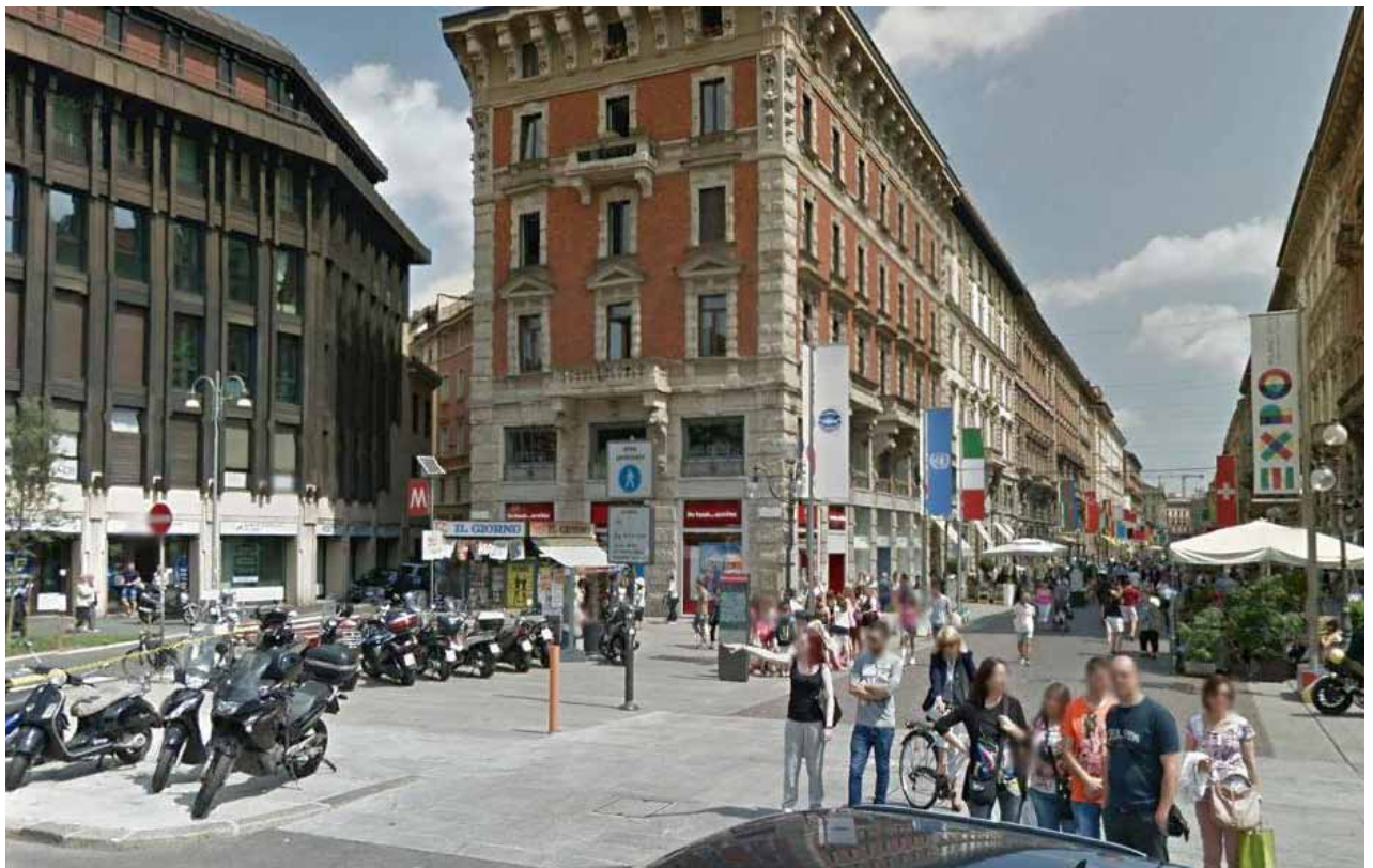
Piazza Cairoli / via Dante Piazza Cairoli / via Dante