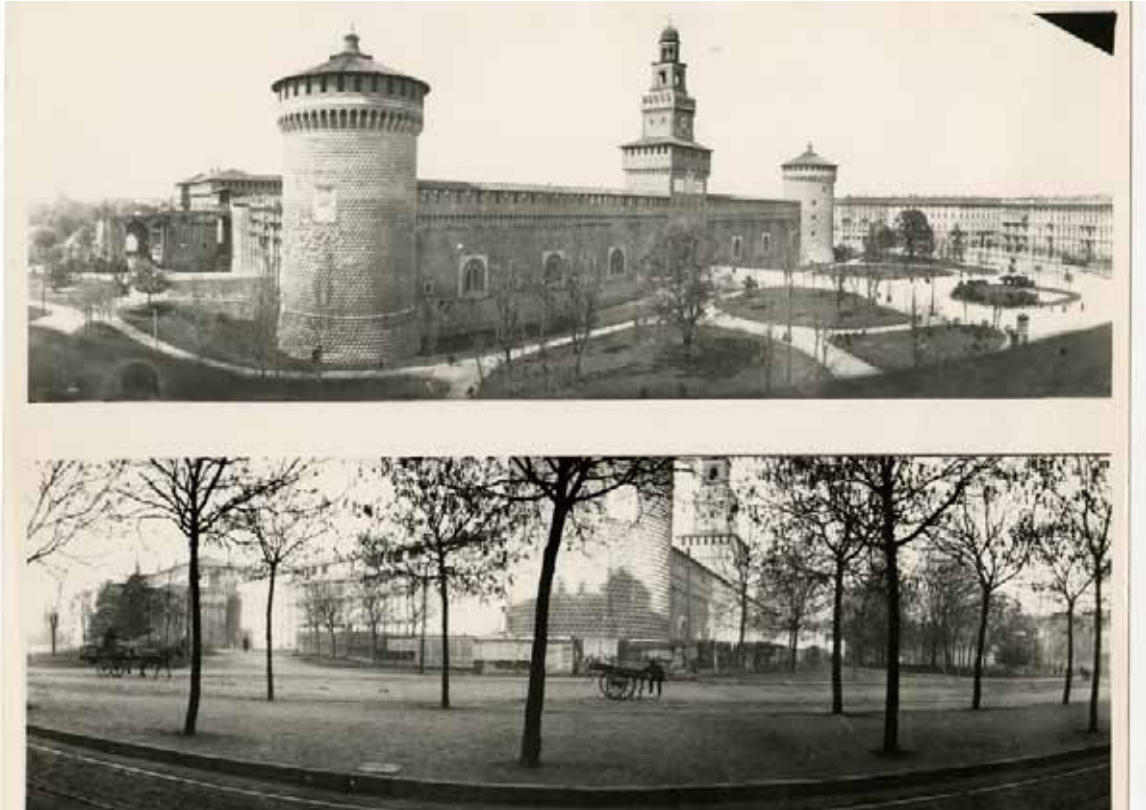
Vedute del Castello Sforzesco: dall'alto e dal Foro Buonaparte, post 1895 Views of Castello Sforzesco: from above and from Foro Buonaparte, post 1895