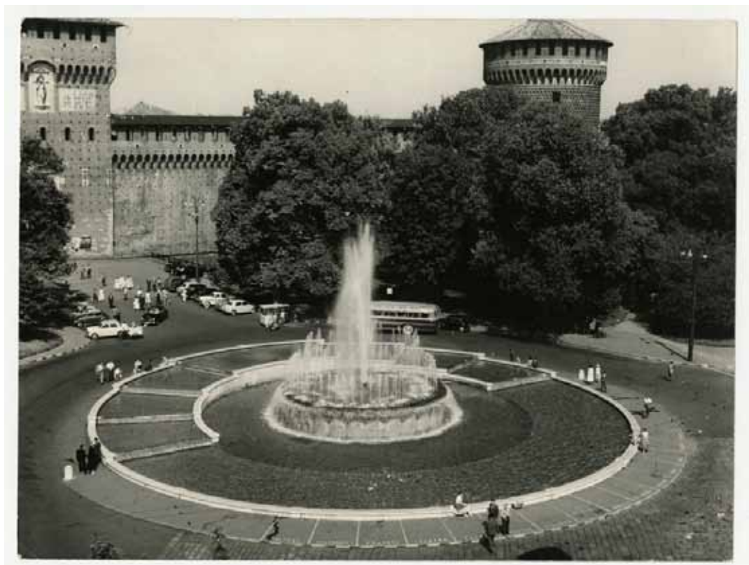
Piazza Castello con veduta della fontana dall'alto. Visibile sullo sfondo la Torre del Filarete e il Torrione est detto del Carmine, Anni Sessanta

Piazza Castello, aerial view. Visible in the background Castello Sforzesco, surrounding buildings, Parco Sempione, via Lanza, via Beretta, via Legnano, 1960s