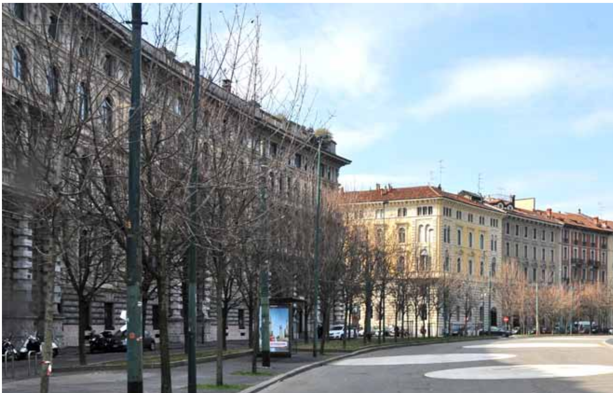
Piazza Castello, vista verso via Beltrami Piazza Castello, view toward via Beltrami