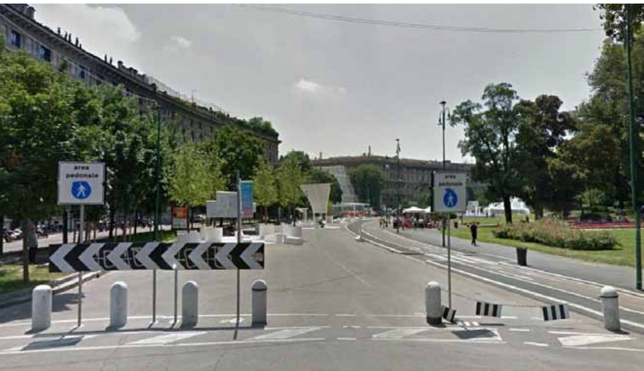
Piazza Castello / Ciclabile Piazza Castello / Bike Path