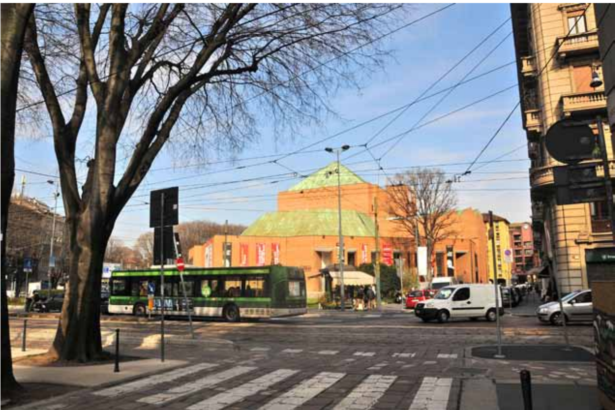
Via Tivoli, vista verso il Piccolo Teatro Via Tivoli, view toward Piccolo Teatro