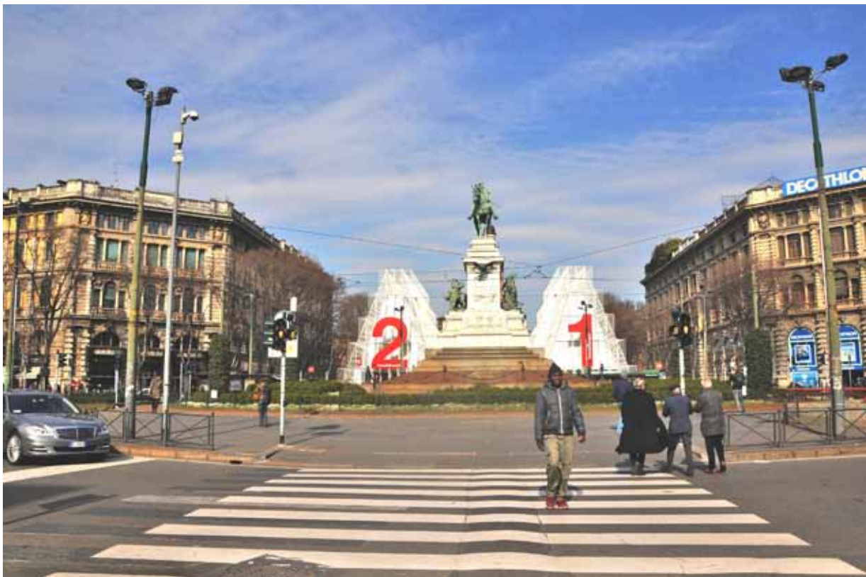
Piazza Cairoli, monumento di Giuseppe Garibaldi e Expo Gate Piazza Cairoli, monument to Giuseppe Garibaldi and Expo Gate