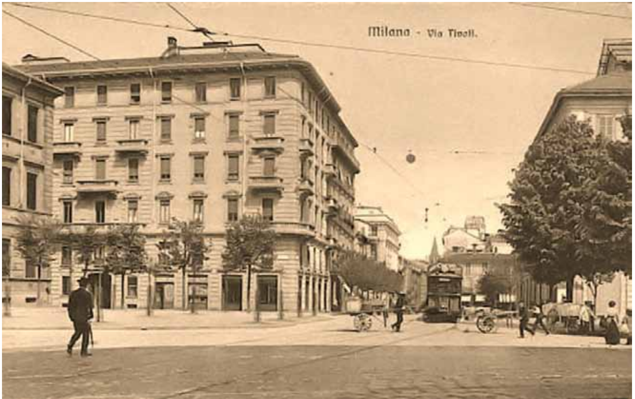
Via Tivoli verso via Pontaccio, 1905 circa Via Tivoli toward via Pontaccio, 1905 circa