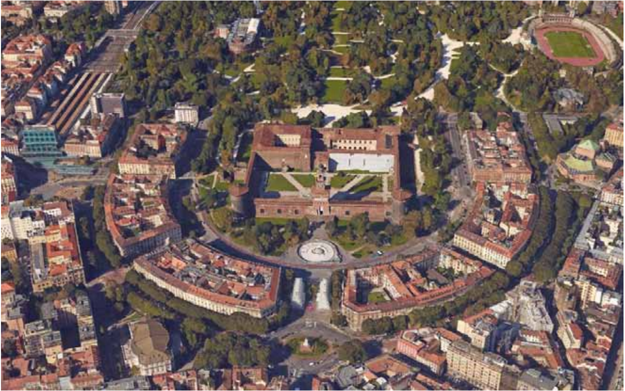
Immagine aerea di Piazza Castello Aerial view of Piazza Castello