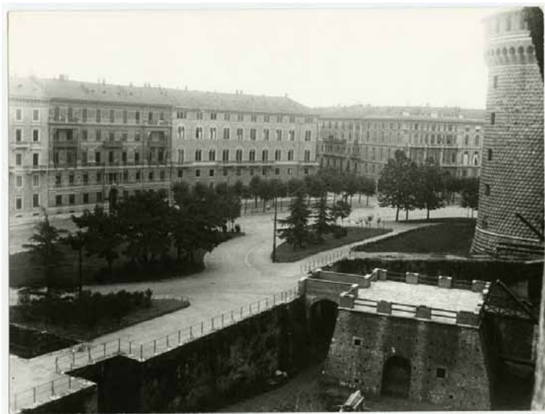
Castello Sforzesco e Foro Buonaparte. Visibile il Torrione del Carmine con il ponte levatoio, anni ottanta Castello Sforzesco and Foro Buonaparte. Visible the Torrione del Carmine with the drawbridge, 1980s