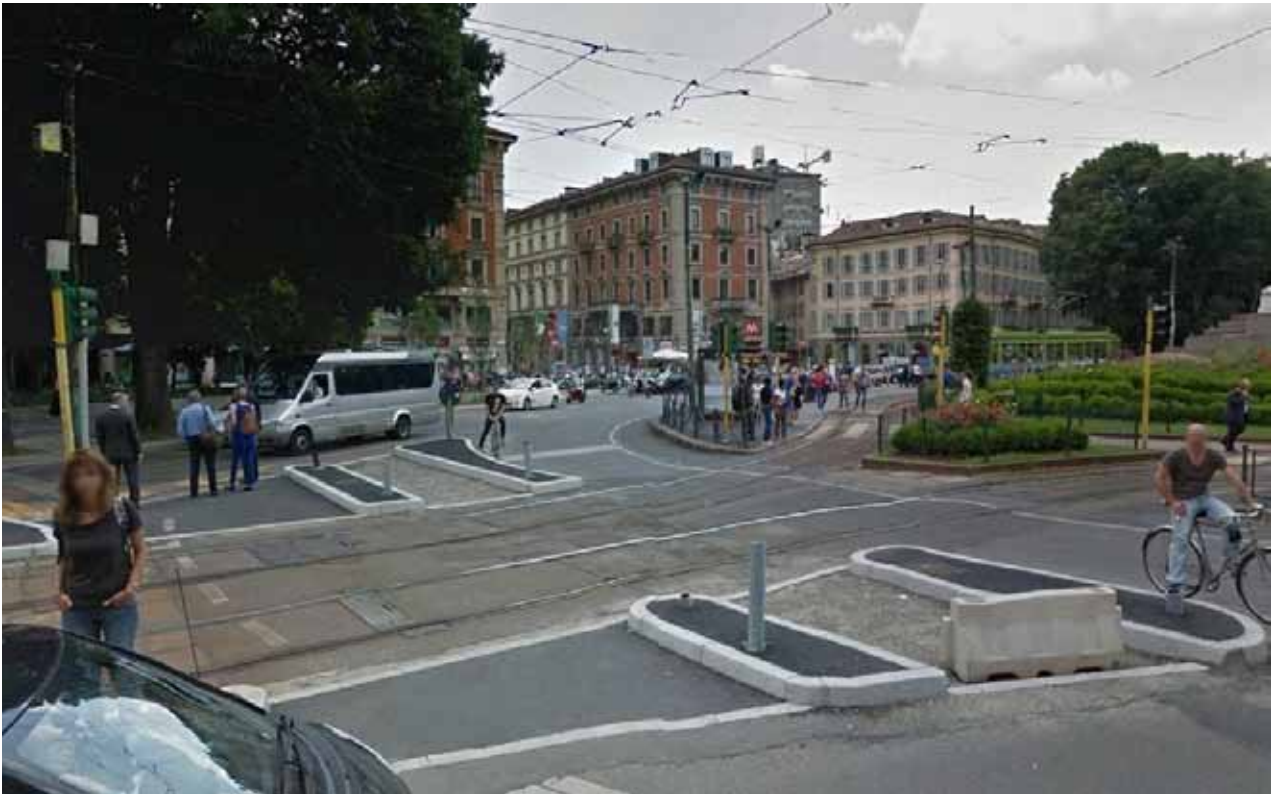
Piazza Cairoli Piazza Cairoli