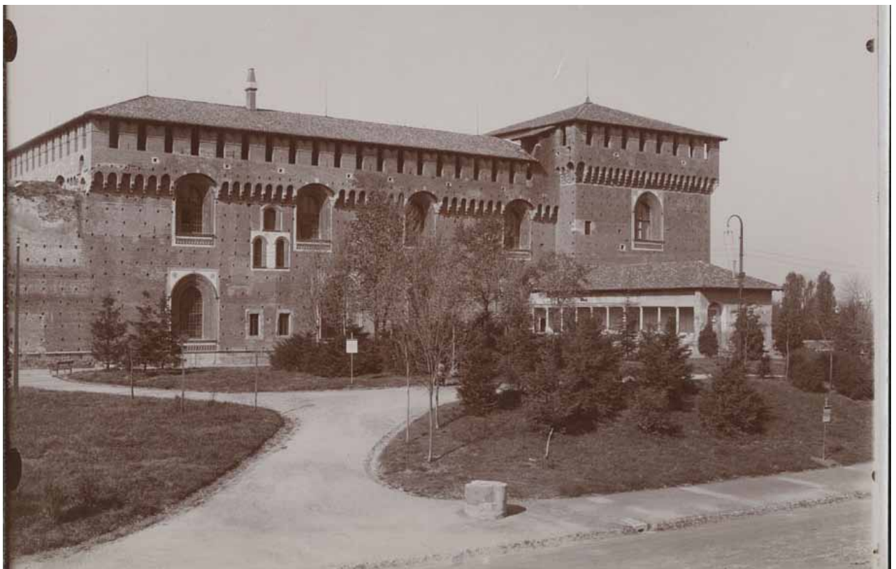
Castello Sforzesco con la Torre Falconiera e la Ponticella di Lodovico il Moro, post 1895