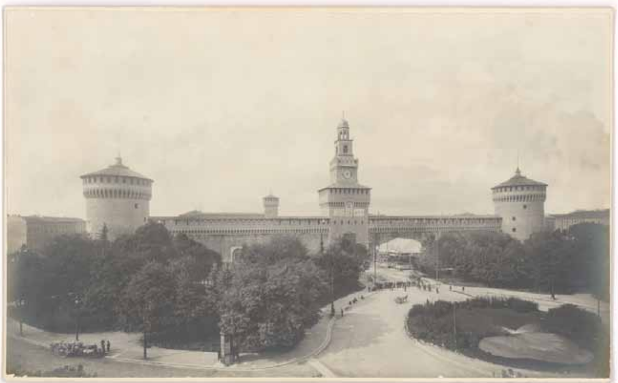
Castello Sforzesco. Veduta del lato est e piazza antistante con la Torre del Filarete e i torrioni circolari, 1893-1905 Castello Sforzesco. View from the east side and piazza in front with the Torre del Filarete and circular defense towers, 1893-1905