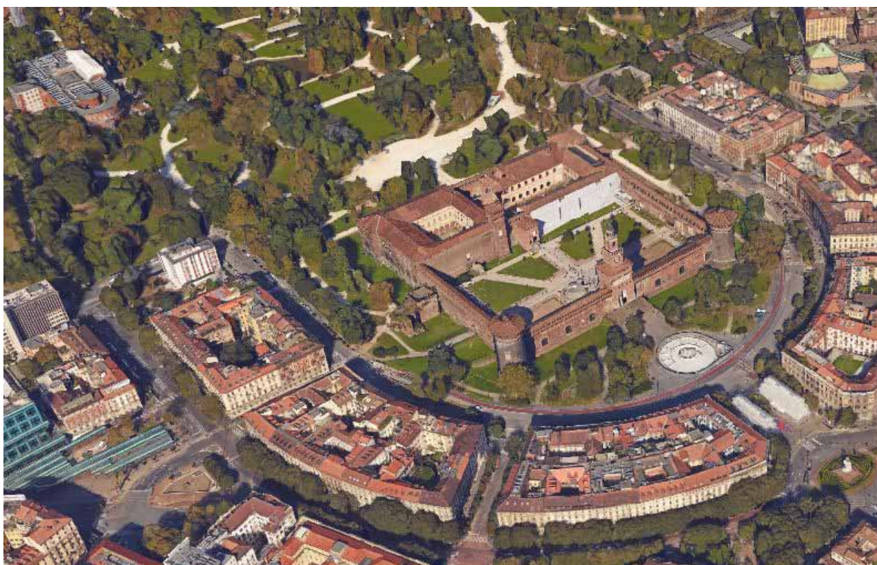
Immagine aerea di Piazza Castello Aerial view of Piazza Castello