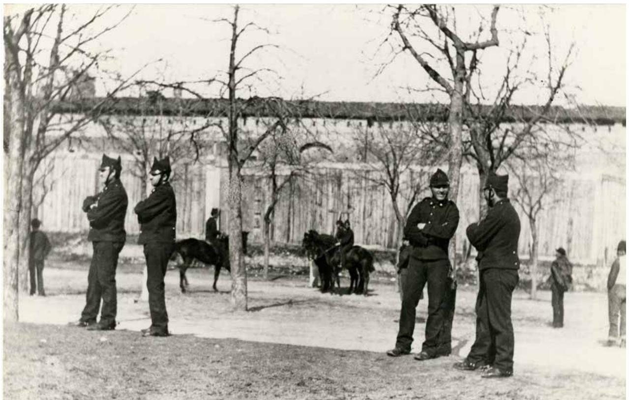
Piazza d'Armi, fine '800 Piazza d'Armi, end of 1800s